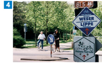
4 Radweg an der Lutter