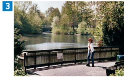
3 Seepanorama am Stauteich III