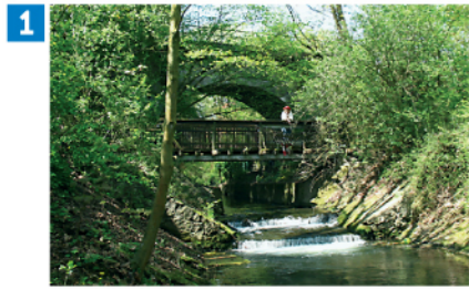
1 Brücke Regionalbahn