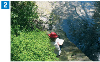
2 Muße am Stauteich II