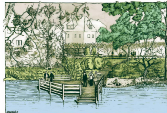
Ideenskizze für ein Holzdeck